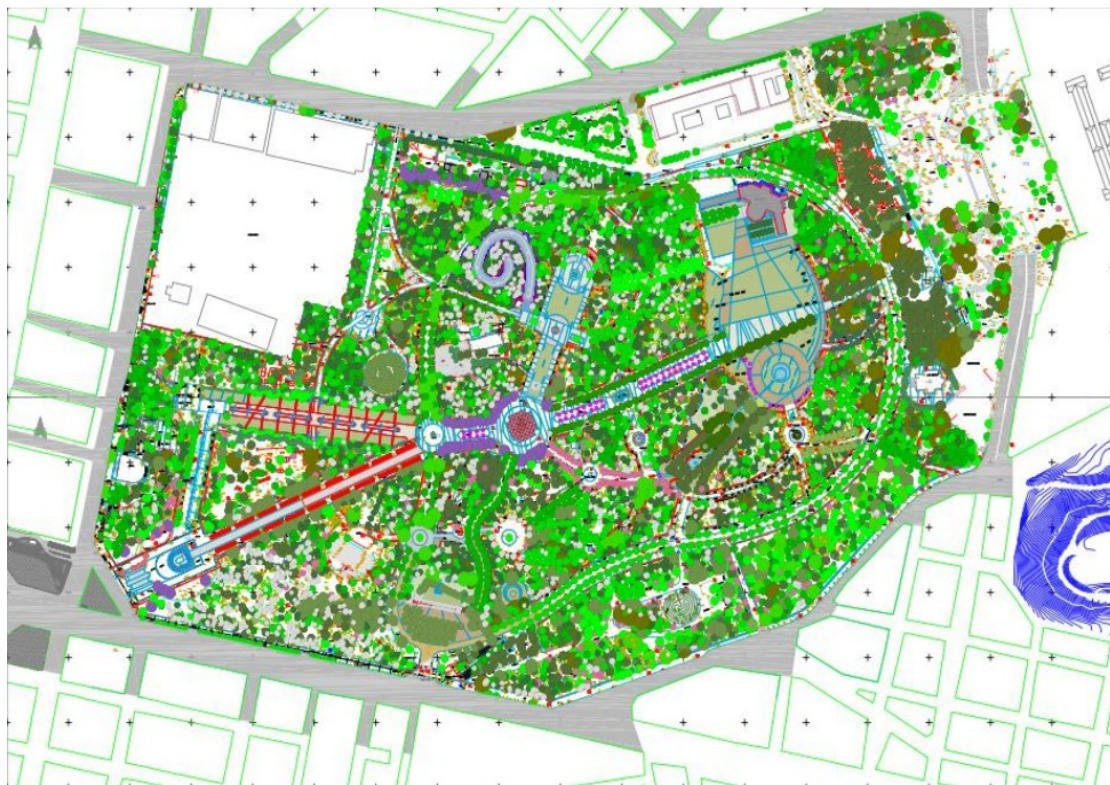
Χάρτης 2: Τοπογραφικό Σχέδιο Πάρκου (2018) Πηγή: Ιστοσελίδα της Υπερνομαρχίας Αθηνών- Πειραιώς